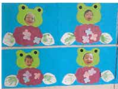
カエルにへ〜んしん！