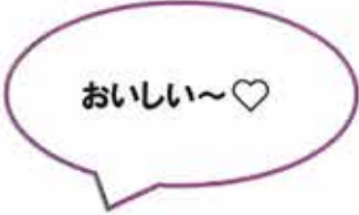
ハイハイお山だ〜いすき♡